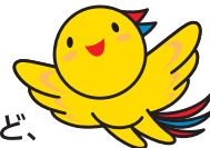
兵庫県マスコットはぼたん

兵庫県内で正社員として働きたい方を対象に 兵庫県内で正社員採用をしている企業とのマッチングを促進するプログラムです。 兵庫県へのUIターン、移住を検討されている方はもちろん、兵庫県で就職したいと考えている方など、 どなたでもご参加いただけます。